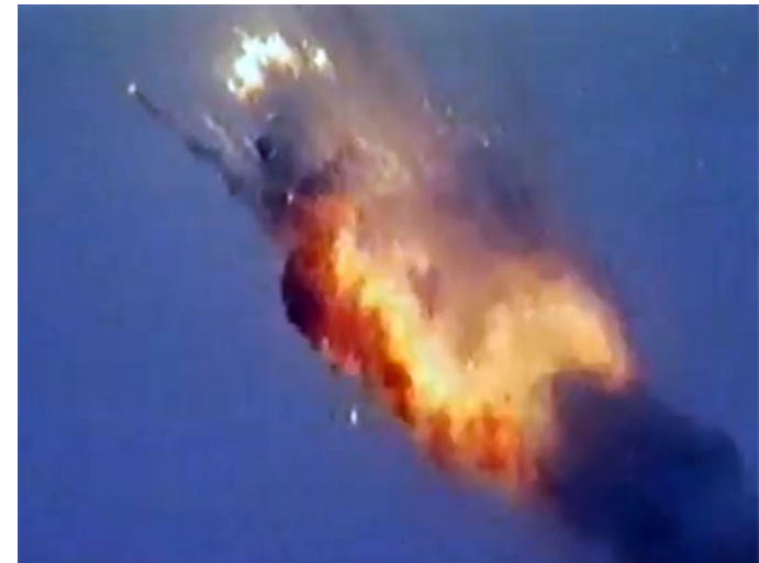
Ariane 5, 4 Juli 1996